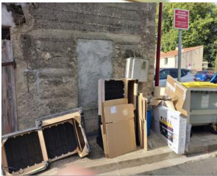
Encombrants déposés le week-end du 1er octobre.

Déposer, abandonner, jeter ou déverser tout type de déchets ou encombrants sur la voie publique (trottoirs ou rue) est puni d'une amende forfaitaire.