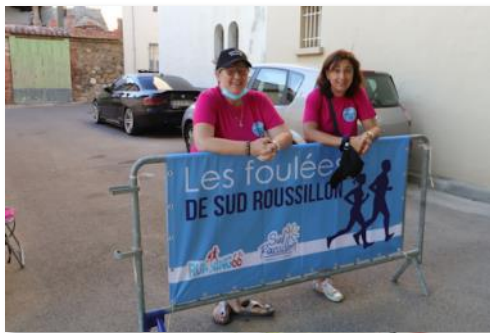
Quelques-uns des bénévoles de Théza

Le jour J, plus de 200 bénévoles ont contribué au bon déroulement de la manifestation dont environ 50 thézains : signaleurs en bord de route, aide au fonctionnement du village départ à Théza, guidage à vélo et ravitaillements, pour lesquels des PIJ et clubs sportifs ont également participé.