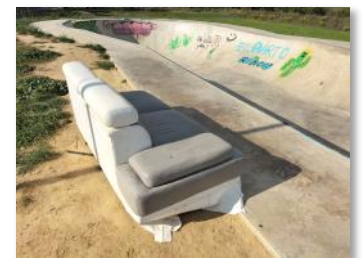
Encombrants déposés le week-end du 1er octobre.

Si vous payez après ce délai de 45 jours, l'amende est de 375 €.