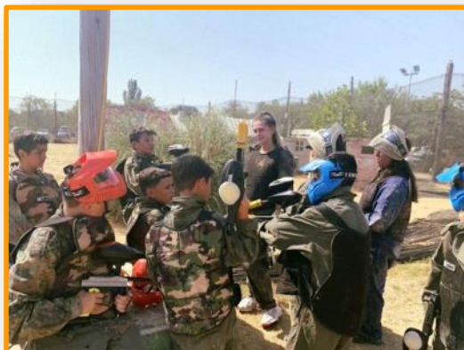
← Paintball à Théza.