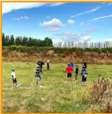
↑ Activités au Skate-park , merci à Brave arts d'avoir animé cette journée de glisse !