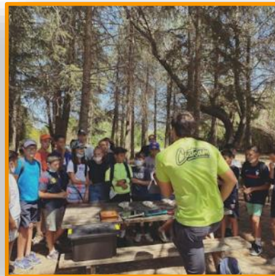
↑ Custeam Perpignan a proposé aux jeunes une chasse au trésor Géoquest .